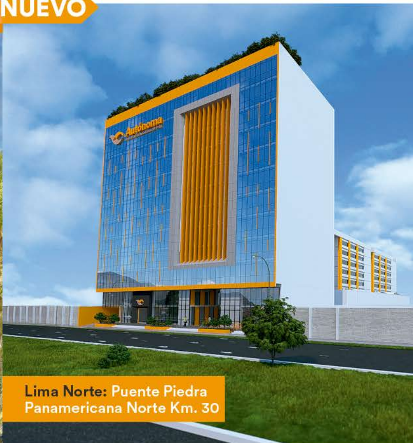
Lima Norte: Puente Piedra Panamericana Norte Km. 30

WhatsApp: 924 372 263 E-mail: informes@autonoma.pe www.autonoma.pe