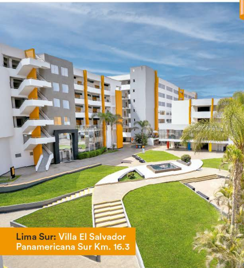
Lima Sur: Villa El Salvador Panamericana Sur Km. 16.3