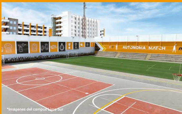
*Imágenes del campus Lima Sur