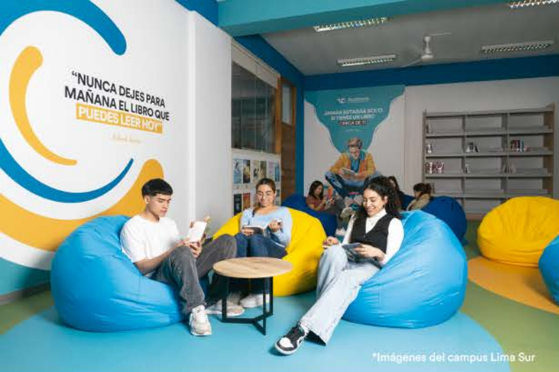
*Imágenes del campus Lima Sur