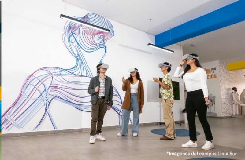
*Imágenes del campus Lima Sur