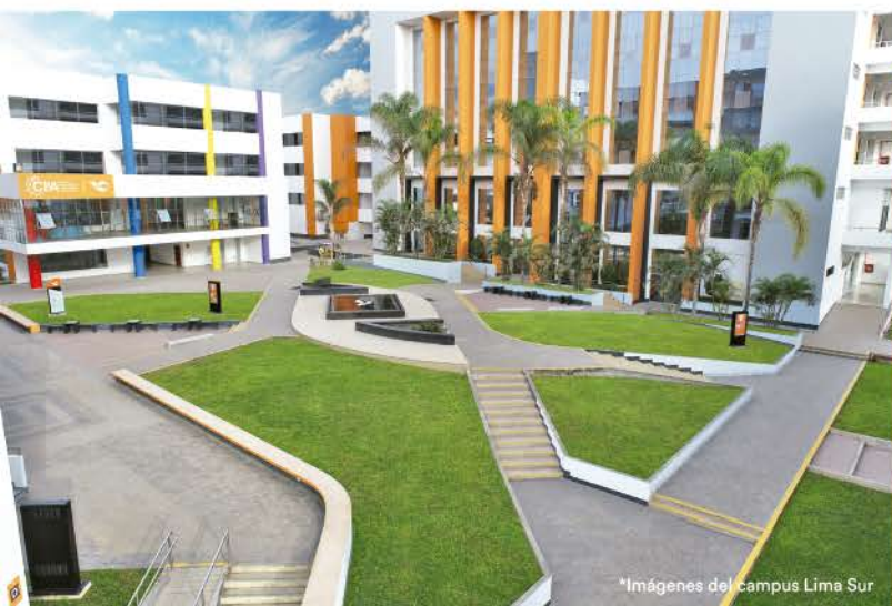
*Imágenes del campus Lima Sur