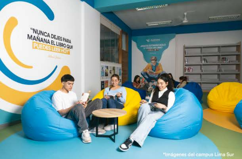
*Imágenes del campus Lima Sur