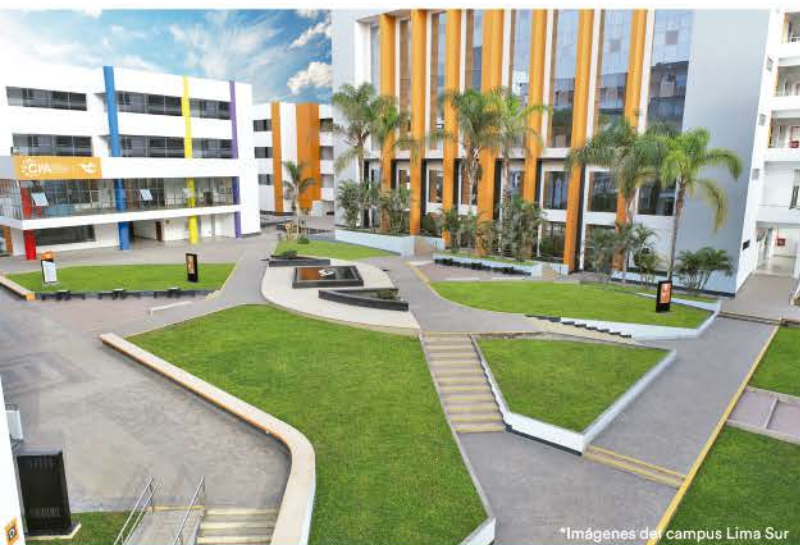
*Imágenes del campus Lima Sur