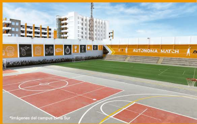
*Imágenes del campus Lima Sur