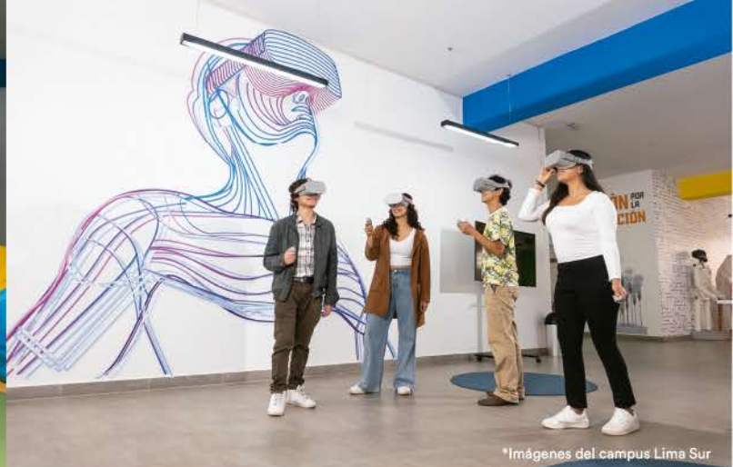
*Imágenes del campus Lima Sur